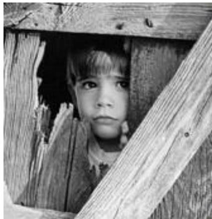
"Figura 5: Nuestro hogar."