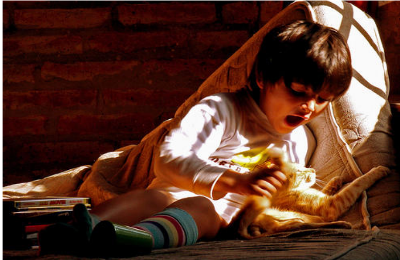
“Figura 7: Sólo sabemos compartir nuestras alegrías, nuestros triunfos y secretos con nosotros mismos.”

Por eso evitamos mezclarnos con ellos . Por ello evitamos el contacto corporal, las caricias, y las muestras de afecto.