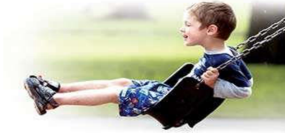
"Figura 3: Balanceo"