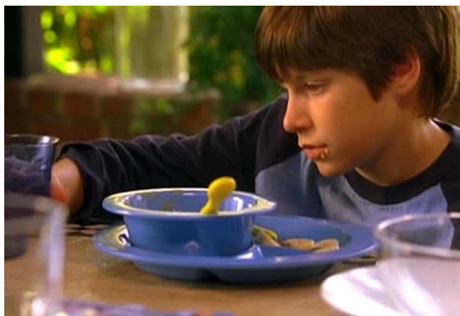
“Figura 18: Dietas a base de vitamina B6 y suplementos de magnesio.”

Llevamos rigurosas dietas especiales sin gluten para ayudar a controlar nuestro comportamiento impulsivo.