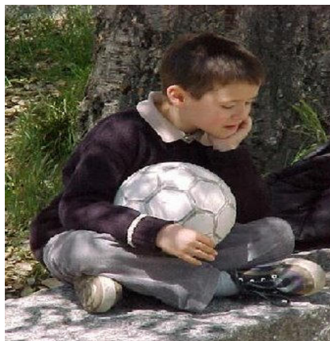
"Figura 6: En el fondo ansiamos sentirnos en compañía."

Pero seguimos atrapados en nuestro refugio interior. La imposibilidad de relacionarnos con el mundo exterior, nos convierte en ermitaños de nuestra propia mente, y nos hace sentir solos.