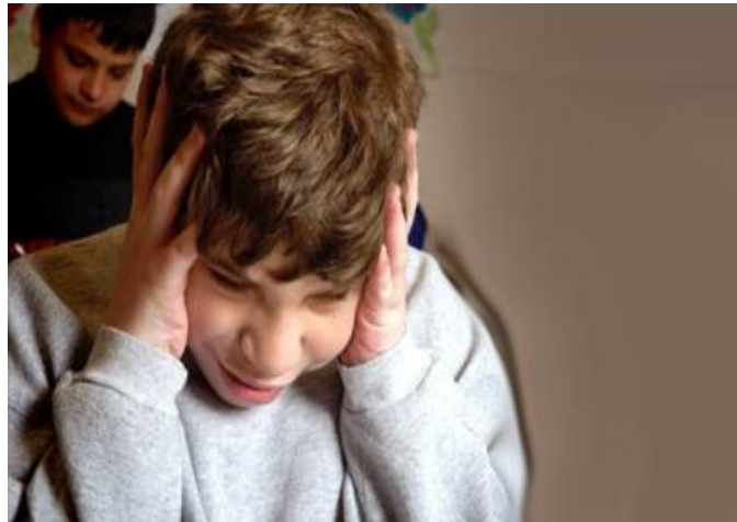
"Figura 4: Ansiedad."

Rehusamos la realidad de ellos . Nos desestabiliza. Es demasiado complicada, irreal, llena de normas sin sentido. No la comprendemos, nos crea ansiedad, y nos vuelve peligrosamente hiperactivos.