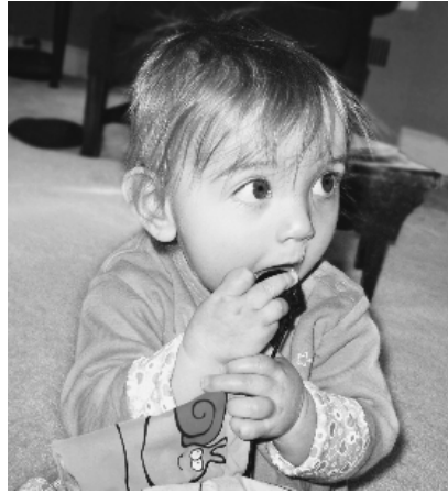
"Figura 15: Los responsables del trastorno podrían ser más de 15 genes distintos."

La primera sugiere que, por un desafortunado asunto del azar, somos autistas por un desorden heredable, por pura lotería genética.