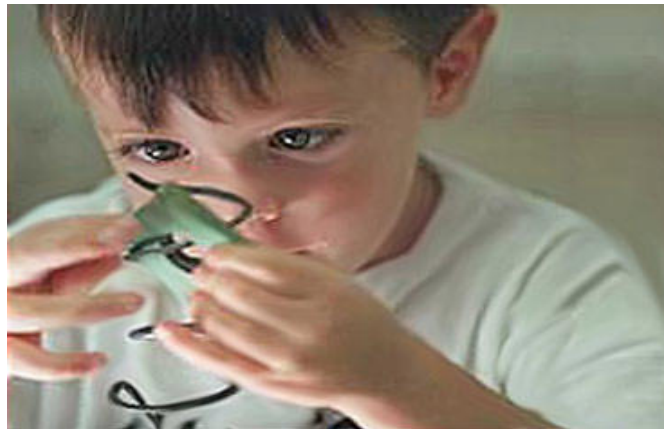
“Figura 14: Los objetos nos hipnotizan durante horas y horas.”