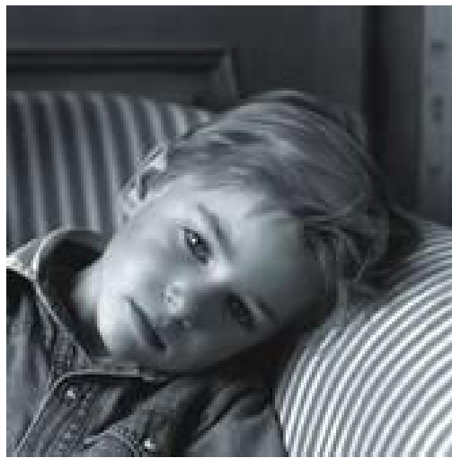
"Figura 1: Melancolía autista"

Podemos llegar a ser seres poderosamente atractivos, la fuente de incalculable misterio que emana nuestra figura aérea con sutileza lo excepcional de nuestra naturaleza. Llevamos día y noche tapizada una máscara de ausencia, fría, carente de emoción, terriblemente estática.