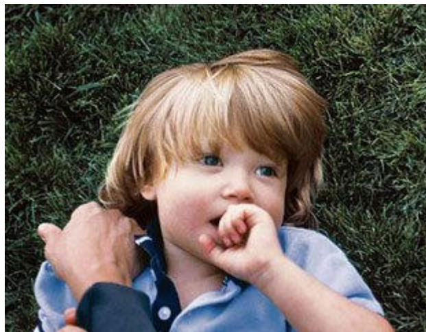
"Figura 11: Tenemos gran capacidad para sobreactuar."

Aunque también tenemos gran facilidad para aprender conductas manipuladoras que satisfagan nuestros objetivos lo que nos genera muy buenos resultados con ellos.