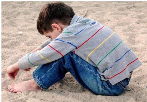
“Figura 9: Apenas experimentamos el hambre, el frío o el sueño”

Pero desde luego, si hay algo que nos hace especiales, es nuestra tolerancia al dolor.