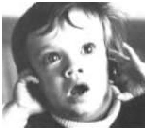
“Figura 17: Cuando comenzamos a tener convulsiones, nos recetan drogas anticonvulsivas.”

Cuando los síntomas de ansiedad, depresión y los trastornos obsesivo-compulsivos acaban alcanzando niveles peligrosos, necesitamos ayuda médica. Es entonces cuando nos recetan antipsicóticos para la depresión y estimulantes para la hiperactividad.