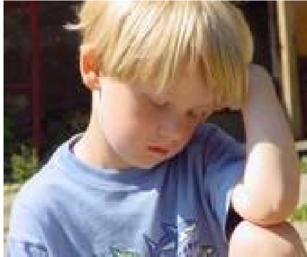
“Figura 8: Con cada parpadeo, recibimos un torrente de imágenes que analizamos con sospecha, en busca de peligro.”

Lo primero que vemos cuando abrimos los ojos es un mundo claroscuro. La potente intensidad de luz que baña nuestro alrededor nos ciega, pero a la vez nos permite percatarnos de infinidad de detalles y pequeños matices que escapan al alcance del ojo humano.