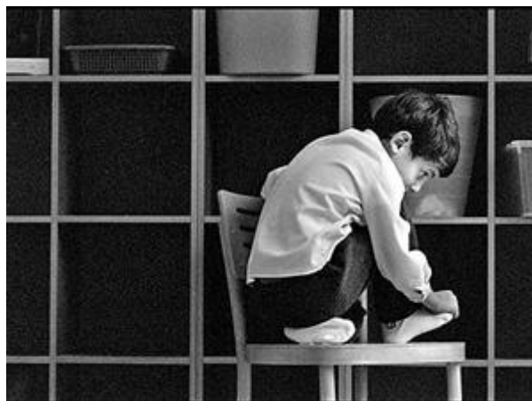
"Figura 2: Nuestro perfil."

La mirada de nuestros ojos es vaga y ligeramente perdida en el vacío, aunque penetrante; no se centra en ningún punto determinado. Nuestra postura corporal denota nuestra total ausencia, permanece siempre relajada, carente de firmeza, abandonada a mohines callados.