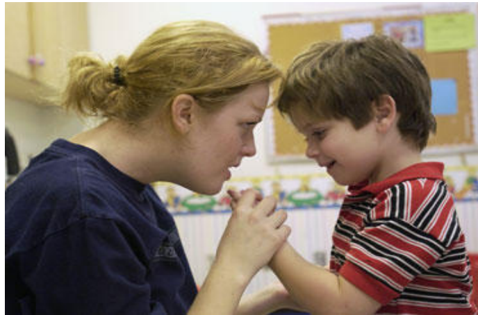
"Figura 10: Gestos."

Nos sentimos incomunicados con el mundo. El flujo de palabras con el que ellos se comunican nos agobia, apenas entendemos nada, y tenemos que valernos de otros métodos para comunicarnos, sobre todo de gestos.