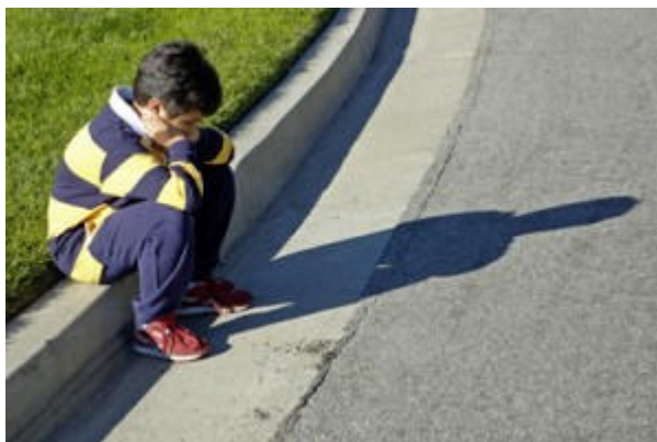
“Figura 19: Somos conscientes de que nuestras vidas están escritas.”

El autismo será nuestro fiel compañero por siempre.