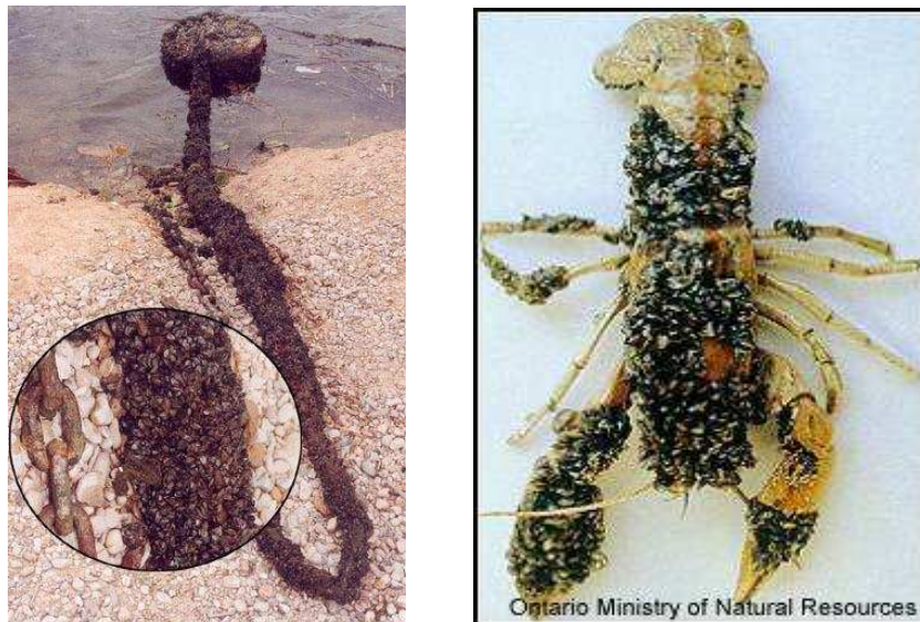
Figura 3: Efectos del mejillón cebra en las infraestructuras y en la fauna.