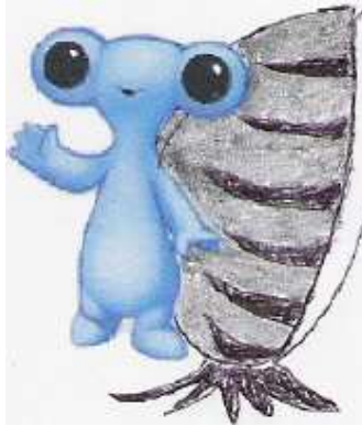
Figura 6: ¿La nueva mascota de la Expo?

¿Qué nos deparará el futuro? Nadie puede saberlo. Por el momento, esta "globalización biológica" carece de solución. Debemos aprender a convivir con ella. Aunque no se puede luchar contra el problema, se puede prevenir. Nunca está de más no liberar especies exóticas. En este momento treinta y cinco mil barcos navegan por alta mar repartiendo nuevos invasores por todo el planeta. ¿Cuál será el próximo en llegar?