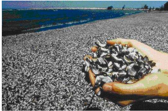
Figura 1: La plaga del mejillón cebra.

La totalidad del Ebro ha sido ya colonizado por larvas de mejillón cebra. El temido molusco ya puede encontrarse en toda la cuenca. ¿Quién no ha oído noticias así últimamente? Numerosos estudios lo confirman: la plaga ya se ha extendido; atrás quedan los tiempos en los que se encontraba sólo en la zona del delta.