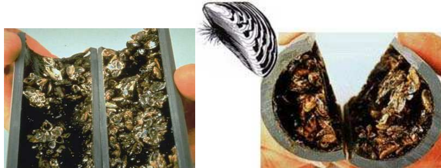
Figura 4: Tuberías obstruidas por el mejillón cebrador.

las conducciones de agua. Aunque pueda parecer un problema no demasiado grave, la obstrucción del agua que refrigera una central nuclear como la de Ascó, es un problema muy delicado.