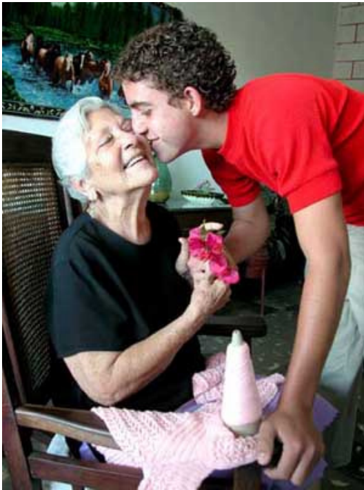
"Figura 1: Es muy importante atender y tratar con cariño al enfermo"

Así que lo llevamos a un médico. Semanas de hospitales que terminaron con una breve pero concisa visita al neurólogo. Mi padre tenía Alzheimer. Fue un duro golpe para todos, pero tuvimos que seguir adelante y aprender a vivir con ello.