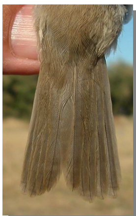
Gorrión molinero. Verano. Diseño y desgaste de la cola: izquierda adulto (03-VII); derecha juvenil (18-VI).