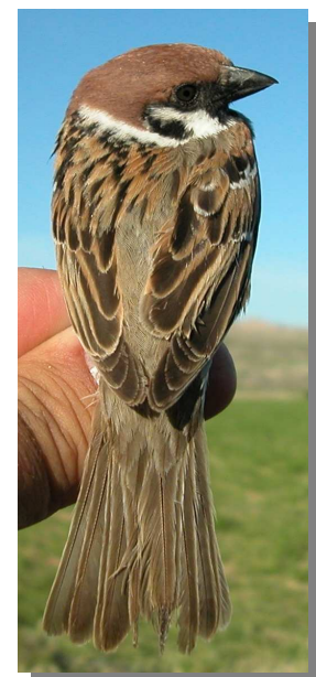
Gorrión molinero. Diseño del dorso: izquierda en invierno (25-X); derecha en primavera (06-V).