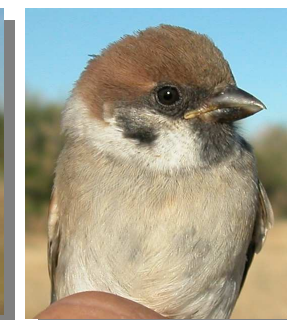
Gorrión molinero. Verano. Diseño del pecho: izquierda adulto (03-VII); derecha juvenil (18-VI).