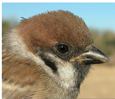
Gorrión molinero. Diseño de la cabeza. De arriba hacia abajo: en invierno (25-X); en primavera (06-V); adulto en verano (03-VII); juvenil (18-VI).