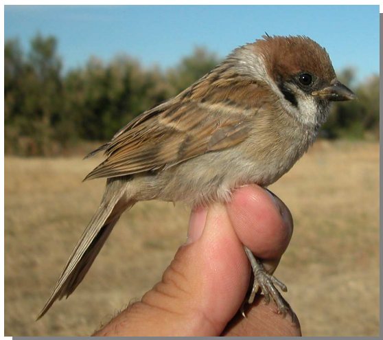
Gorrión molinero. Verano. Juvenil (18-VI).