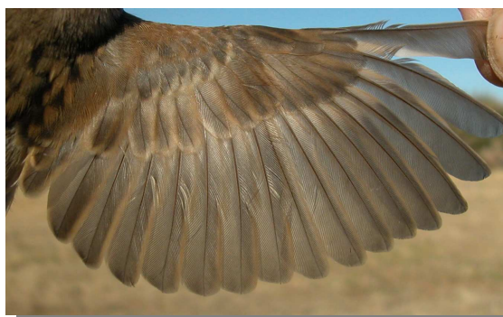
Gorrión molinero. Verano. Juvenil: diseño del ala (29-VII).