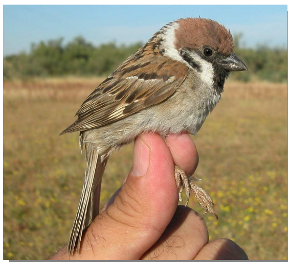
Gorrión molinero. Verano. Adulto (03-VII).