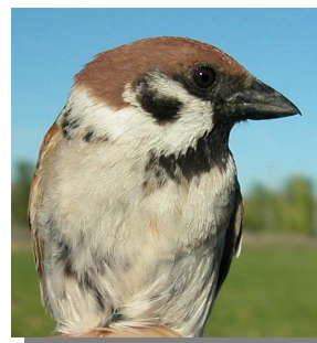
Gorrión molinero. Diseño del pecho: izquierda en invierno (25-X); derecha en primavera (06-V).