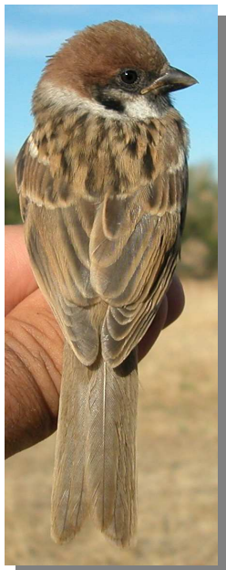
Gorrión molinero. Verano. Diseño del dorso: izquierda adulto (03-VII); derecha juvenil (18-VI).