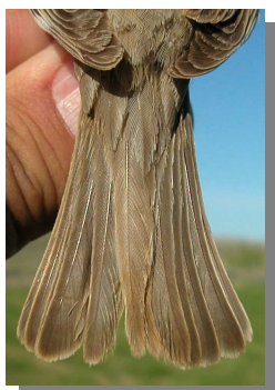
Gorrión molinero. Diseño y desgaste de la cola: izquierda en invierno (25-X); derecha en primavera (06-V).