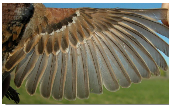
Gorrión molinero. Primavera: diseño del ala (06-V).