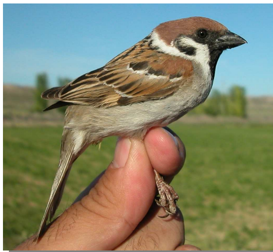
Gorrión molinero. Primavera. Adulto (06-V).

Sedentario. Ampliamente repartido por toda la Comunidad faltando en las áreas más montañosas y deforestadas de la Depresión del Ebro.