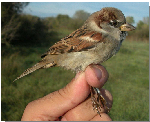
Gorrión común. Macho en invierno.

Podría haber confusión con los machos de gorrión común , que tiene el capirote gris y babero negro que le baja por el pecho.