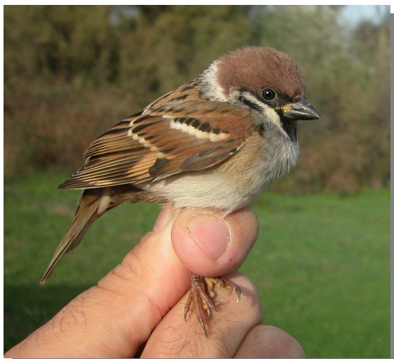
Gorrión molinero. Invierno (25-X).