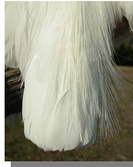
Garceta común. Primavera. Adulto: diseño de la cola (10-III)