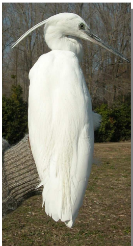
Garceta común. Primavera. Adulto: diseño del dorso (10-III)