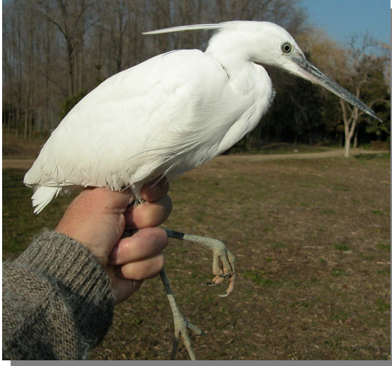
Garceta común. Primavera. Adulto (10-III)