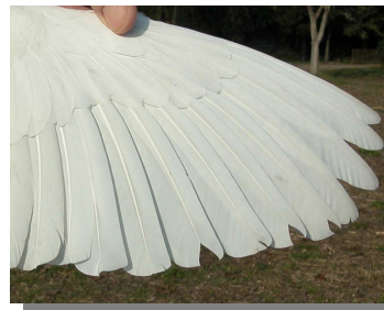
Garceta común. Primavera. Adulto: diseño de primarias (10-III)