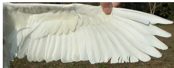
Garceta común. Primavera. Adulto: diseño del ala (10-III)