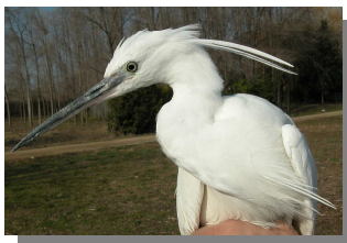
Garceta común. Primavera. Adulto: diseño del pecho (10-III)