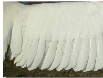
Garceta común. Primavera. Adulto: diseño de secundarias (10-III)