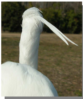
Garceta común. Primavera. Adulto: diseño de la nuca (10-III)