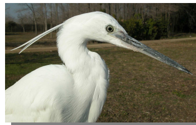
Garceta común. Primavera. Adulto: diseño de la cabeza (10-III)

Especie estival, con algunos ejemplares invernantes. Presente como nidificante en algunos enclaves del río Ebro, estando más dispersa en época de paso.