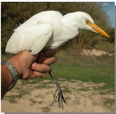
Garcilla bueyera: plumaje no nupcial.

Entre las garzas blancas, podría existir confusión con la garcilla bueyera , que tiene el capirote ocre, el pico amarillo y patas del mismo color que los dedos. La garceta grande es de tamaño mucho mayor (85-102 cm).