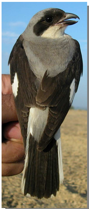
Alcaudón chico. Verano. Hembra: diseño del dorso (11-VII).