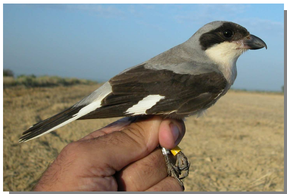
Alcaudón chico. Verano. Hembra (11-VII).