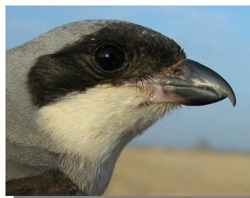
Alcaudón chico. Verano. Hembra: diseño de la cabeza (11-VII).

Especie estival. Nidificante muy escaso y localizado en el oriente de la provincia de