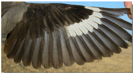
Alcaudón chico. Verano. Hembra: diseño del ala (11-VII).