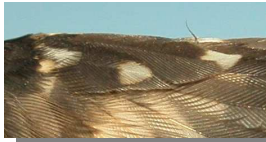
Agateador común. Izquierda diseños del álula; abajo diseño de las manchas ocreas del ala, de la cola y puntas de las primarias internas.