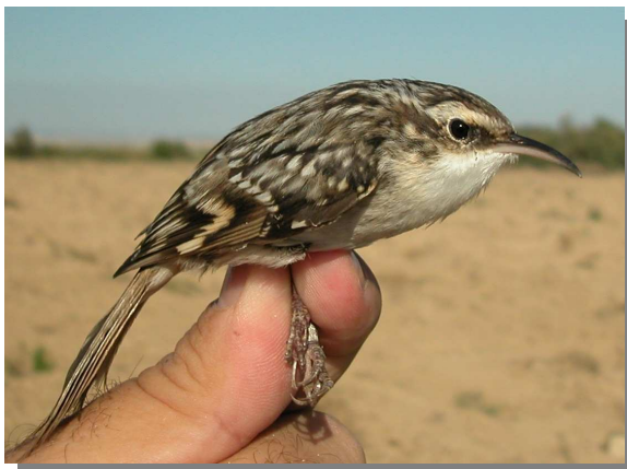
Agateador común. Adulto (26-IX).

AGATEADOR COMÚN ( Certhia brachydactyla )