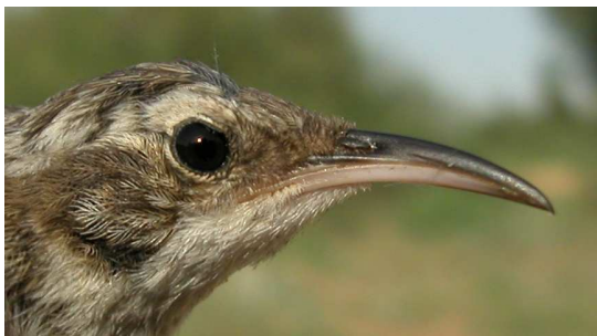
Agateador común. Diseño de la cabeza: arriba adulto (26-IX); abajo juvenil (19-VII).