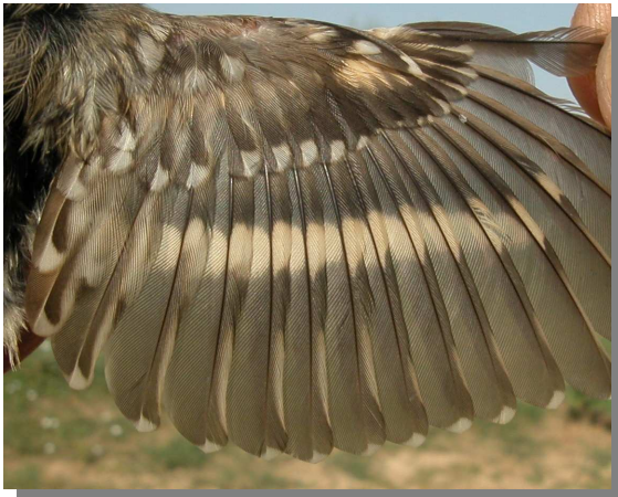
Agateador común. Juvenil: diseño del ala (19-VII).