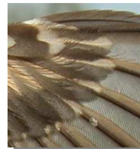
Agateador común. Diseño de la mancha y de la punta de la cobertera primaria más larga: izquierda adulto (22-VIII); derecha juvenil (26-VI).