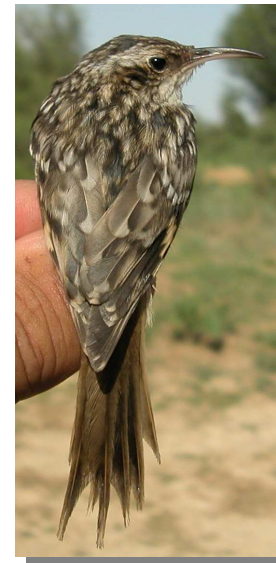
Agateador común. Diseño del dorso: izquierda adulto (26-IX); derecha juvenil (19-VII).