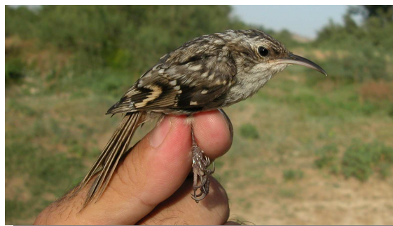
Agateador común. Juvenil (19-VII).

Es una especie sedentaria ampliamente distribuida por todas las zonas forestales de la Comunidad.