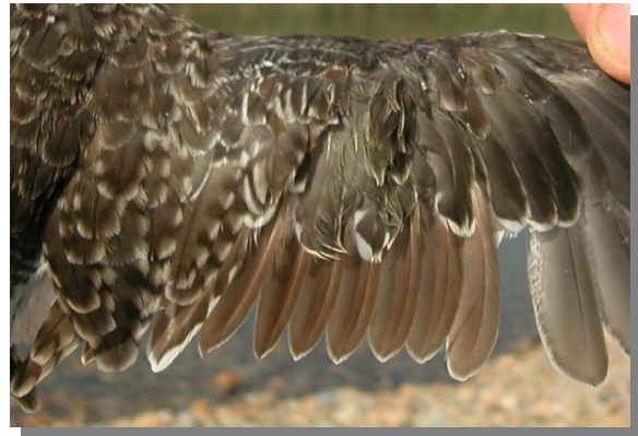
Andarríos bastardo. Otoño. Adulto en muda activa: diseño de secundarias (18-VIII)