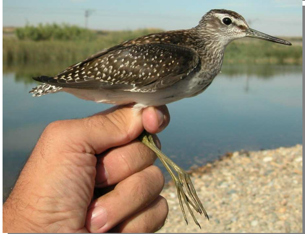
Andarríos bastardo. Otoño. Juvenil (26-VIII).