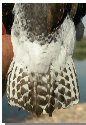
Andarríos bastardo. Otoño. Diseño de la cola: arriba izquierda adulto no mudado (29-VII); arriba derecha adulto en muda activa (18-VIII); izquierda juvenil (26-VIII).