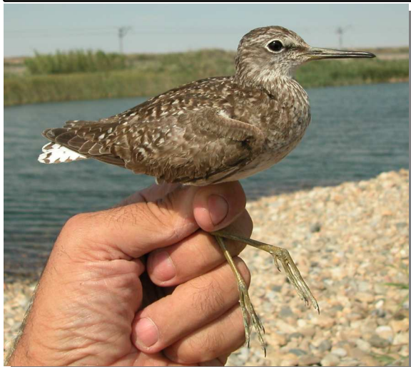
Andarríos bastardo. Otoño. Adulto (29-VII).