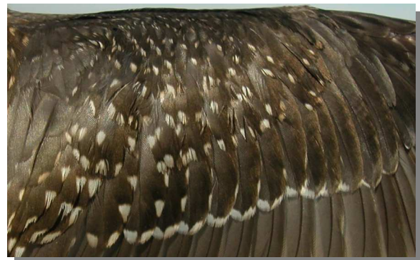
Andarríos bastardo. Otoño. Juvenil: diseño de coberteras del ala (26-VIII)