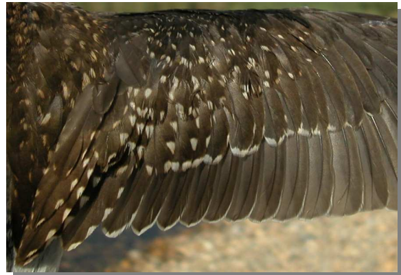
Andarríos bastardo. Otoño. Juvenil: diseño de secundarias (26-VIII)