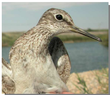
Andarríos bastardo. Otoño. Diseño del pecho: arriba adulto (29-VII); abajo juvenil (26-VIII).