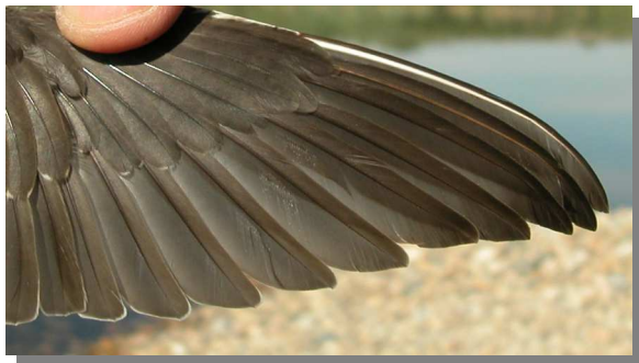
Andarríos bastardo. Otoño. Juvenil: diseño de primarias (26-VIII)