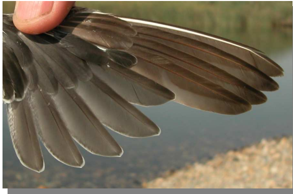
Andarríos bastardo. Otoño. Adulto en muda activa: diseño de primarias (18-VIII)