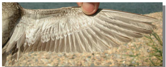
Andarríos bastardo. Otoño. Adulto no mudado: diseño del ala (29-VII)