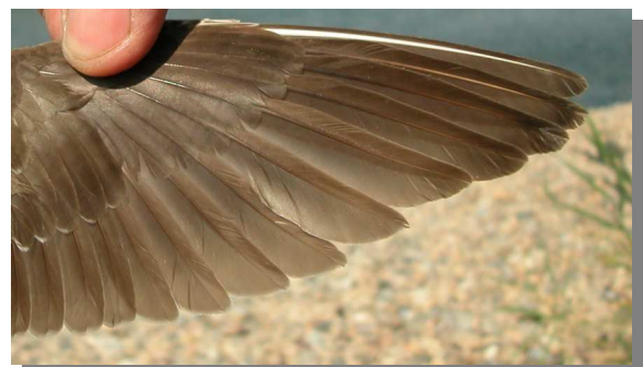
Andarríos bastardo. Otoño. Adulto no mudado: diseño de primarias (29-VII)