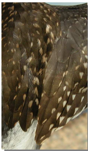
Andarríos bastardo. Otoño. Diseño de terciarias y escapulares: arriba izquierda adulto no mudado (29-VII); arriba derecha adulto en muda activa (18-VIII); izquierda juvenil (26-VIII).