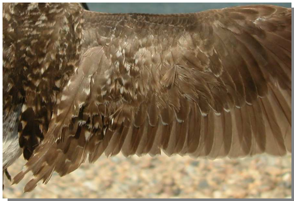
Andarríos bastardo. Otoño. Adulto no mudado: diseño de secundarias (29-VII)