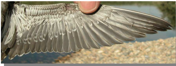
Andarríos bastardo. Otoño. Juvenil: diseño del ala (26-VIII)