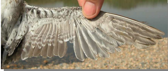
Andarríos bastardo. Otoño. Adulto en muda activa: diseño del ala (18-VIII)