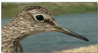
Andarríos bastardo. Otoño. Diseño de la cabeza: arriba adulto (29-VII); abajo juvenil (26-VIII).