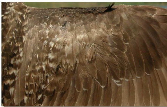
Andarríos bastardo. Otoño. Adulto no mudado: diseño de coberteras del ala (29-VII)